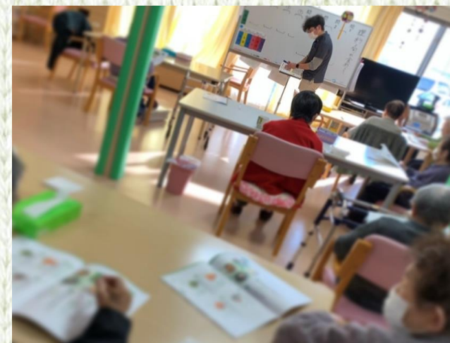
脳トレク「大人の学校」の授業風景