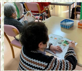
脳トレレク「大人の学校」の授業風景